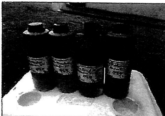
Fotografía 1: Toma de Muestra